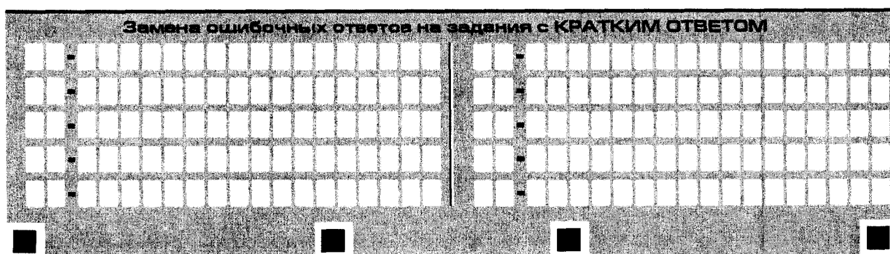
Рис. 8. Область замены ошибочных ответов на задания с кратким ответом

Запрещается записывать ответ в виде математического выражения или формулы. В ответе не указываются названия единиц измерения (градусы, проценты, метры, тонны и т.д.) – так как они не будут учитываться при оценивании. Недопустимы заголовки или комментарии к ответу.